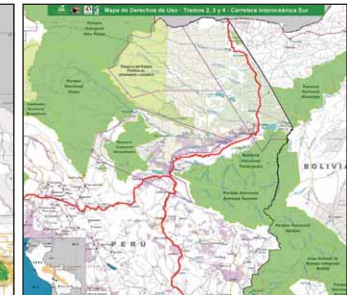
Carretera Interoceánica Sur