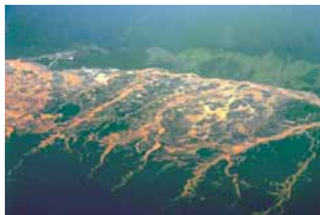
Deforestación y contaminación de ríos, por minería de Oro, Huaypetue