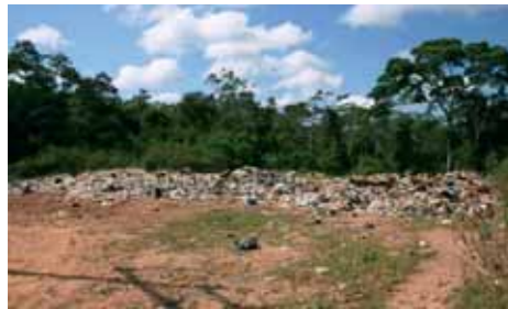
Basurero en Iberia, al lado de la Interoceánica Sur

El Grupo de Trabajo participa en el Consejo Consultivo del Programa de Gestión Social y Ambiental del Corredor Vial Interoceánico Sur (el programa estatal de mitigación de los impactos indirectos de la carretera, mejor conocido como CAF/INRENA ), con dos representantes acreditados por la Sociedad Nacional del Ambiente. Tiene además representantes en las Comisiones Ambientales Regionales de Madre de Dios y Cuzco. Varios de sus miembros participan también en el Grupo Peruano de Interés en IIRSA, colectivo afín a la Articulación frente a IIRSA.