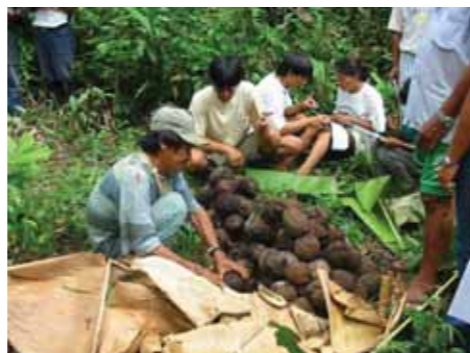
Conteo producción de cocos de castañas por árbol

Su existencia reconoce la enorme diversidad cultural y ecológica entre las regiones afectadas por la Interoceánica Sur; los distintos climas políticos regionales; así como la pericia, el talento y el tejido social nativos de cada región. Los grupos están organizados por prioridades regionales y comprometidos en promover el diálogo y la cooperación con las organizaciones de base y los gobiernos regionales y locales. A partir de Julio 2007, cada Grupo Regional cuenta con un Plan de Acción Anual que especifica prioridades y compromisos colectivos. Estos primeros Planes de Acción Anual son verdaderos mapas de las preocupaciones estratégicas de la sociedad civil en cuanto a conservación y desarrollo en cada región, así como radiografías de las capacidades colectivas. Una tarea central de los Grupos Regionales es informarse e informar permanentemente sobre las decisiones y procesos relacionados con la Interoceánica Sur, sobre todo en cuanto a las interrelaciones e interdependencias ecológicas, económicas y sociales entre las regiones conectadas por la Interoceánica Sur.