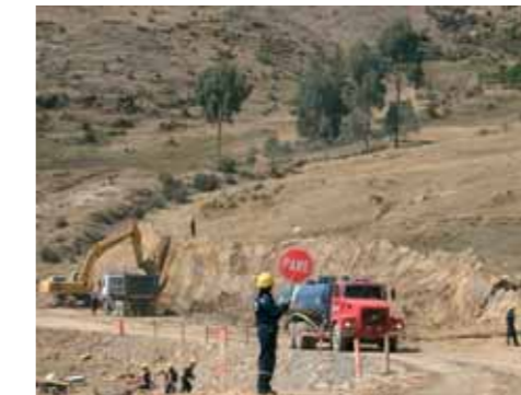
Ocongate, Carretera Interoceánica Sur

Es un colectivo igualitario de organizaciones no gubernamentales, instituciones académicas e individuos preocupados por los impactos directos e indirectos, sociales y ambientales, del asfaltado de la carretera Interoceánica Sur en el Perú. La preocupación del Grupo de Trabajo radica en que, en ausencia de planes y de inversiones significativas para un desarrollo sostenible en el ámbito de la obra, el asfaltado de la carretera estimula, por defecto, procesos socio-económicos destructivos y ya dominantes en la región, basados en la migración espontánea de colonos altoandinos a la selva, para ocuparse en la tala ilegal, la minería de oro informal y sumarse a un crecimiento urbano descontrolado. Esto viene agravando pasivos sociales y ambientales previamente existentes, como la carencia de servicios básicos, la deforestación improductiva, la invasión de las áreas protegidas y la contaminación de los ríos por mercurio.