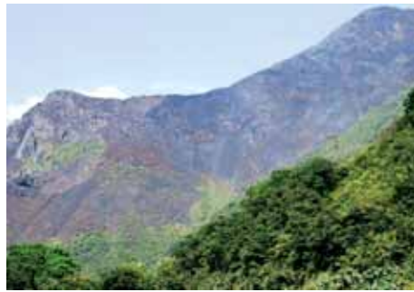
Quemas de pasto en Marcapata

la Interoceánica Sur, el Grupo de Madre de Dios, en cercana coordinación con el Gobierno Regional, dinamizó el proceso de observaciones técnicas a los Estudios de Impacto Socio-Ambiental para el Tramo 3, el proceso de revisión de los Planes Operativos Anuales 2007 del Programa CAF/INRENA y el cabildeo para fortalecer la participación regional en la gestión de dicho Programa. En este tema, promovió el diálogo y el consenso propositivo entre los gobiernos regionales de Madre de Dios, Cuzco y Puno. Además, el Grupo Regional junto con el Gobierno Regional y las federaciones indígena y campesina obtuvieron el rechazo de los Estudios de Impacto Ambiental de los Lotes de Hidrocarburos 111 y 113 preparados por la consultora GEMA, que contenían burdos plagios de estudios previos realizados en otra región. Finalmente, el Grupo, nuevamente al lado del Gobierno Regional y las organizaciones de base, actuó enérgicamente para proteger de la minería informal el Lago Valencia, el espejo de agua más extenso de Madre de Dios, principal enclave pesquero y territorio de comunidades indígenas y ribereñas. Actualmente, sobre la base de una agenda unificada, se discuten alternativas para zonificar y ordenar la actividad minera aluvial, y para proteger los ecosistemas palustres y lacustres de Madre de Dios en un sistema de conservación regional.