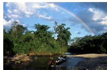
Río Chingantza

La Cordillera del Cóndor durante cientos de años ha sido considerada como un lugar sagrado para las comunidades indígenas Shuar, Ashuar, Awajún y Wampis. Estas culturas cuentan con conocimientos tradicionales que han permitido el desarrollo de métodos sostenibles de pesca, caza, agricultura y extracción de productos de los bosques. Así mismo, estas poblaciones se caracterizan por su reconocida actitud bélica y sentido de pertenencia sobre el territorio. Estas expresiones se basan en una estrecha relación cosmogónica con su entorno como es el caso con las cascadas, denominadas "tunas" que son áreas en las cuales se reproduce parte de las prácticas ancestrales de estos pueblos indígenas. Estas poblaciones indígenas creen en el significado sagrado de las aguas que son la fuente que proporciona la vida a todo su entorno vital y de su cosmovisión.