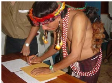
Firma de acuerdos para la creación del Parque (Huampami 29 y 30 de marzo, 2004).

El trabajo liderado por CI-Perú ha tenido resultados gracias a la participación de las Organizaciones Indígenas ODECOFROC, ODECINAC, FECOHRSA CAH- Consejo Aguaruna Huambisa. Así mismo por la colaboración de las ONGS APECO e IBC; las Organizaciones Gubernamentales Intendencia de Áreas Naturales Protegidas del INRENA, Plan Binacional Ecuador-Perú, Capítulo Peruano, Proyecto Especial de Titulación de Tierras y Catastro Rural – PETT, y el Consejo Nacional del Ambiente - CONAM. Los Gobiernos locales y regionales incluyendo la Municipalidad Distrital de El Cenepa, Municipalidad Provincial de Condorcanqui y el Gobierno Regional de Amazonas. Todos estos actores han sido claves en este proceso.