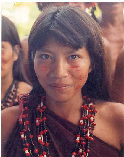
Joven de Nampag

Nuestra Misión Conservación Internacional cree que el patrimonio natural del planeta debe mantenerse para que las generaciones futuras puedan florecer espiritual, cultural y económicamente. Nuestra misión es contribuir a la conservación de esta herencia viva de la Tierra y demostrar que las sociedades humanas pueden convivir en armonía con la naturaleza.