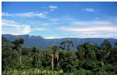
Cordillera del Cóndor