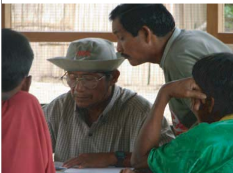
Pobladores Awajún y Wampis durante los talleres de Reflexión 6 y 7 en el Perú.